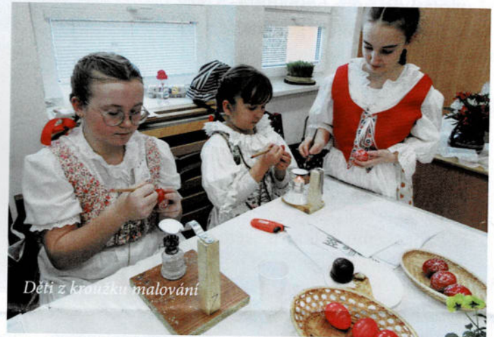
Děti z kroužku malování