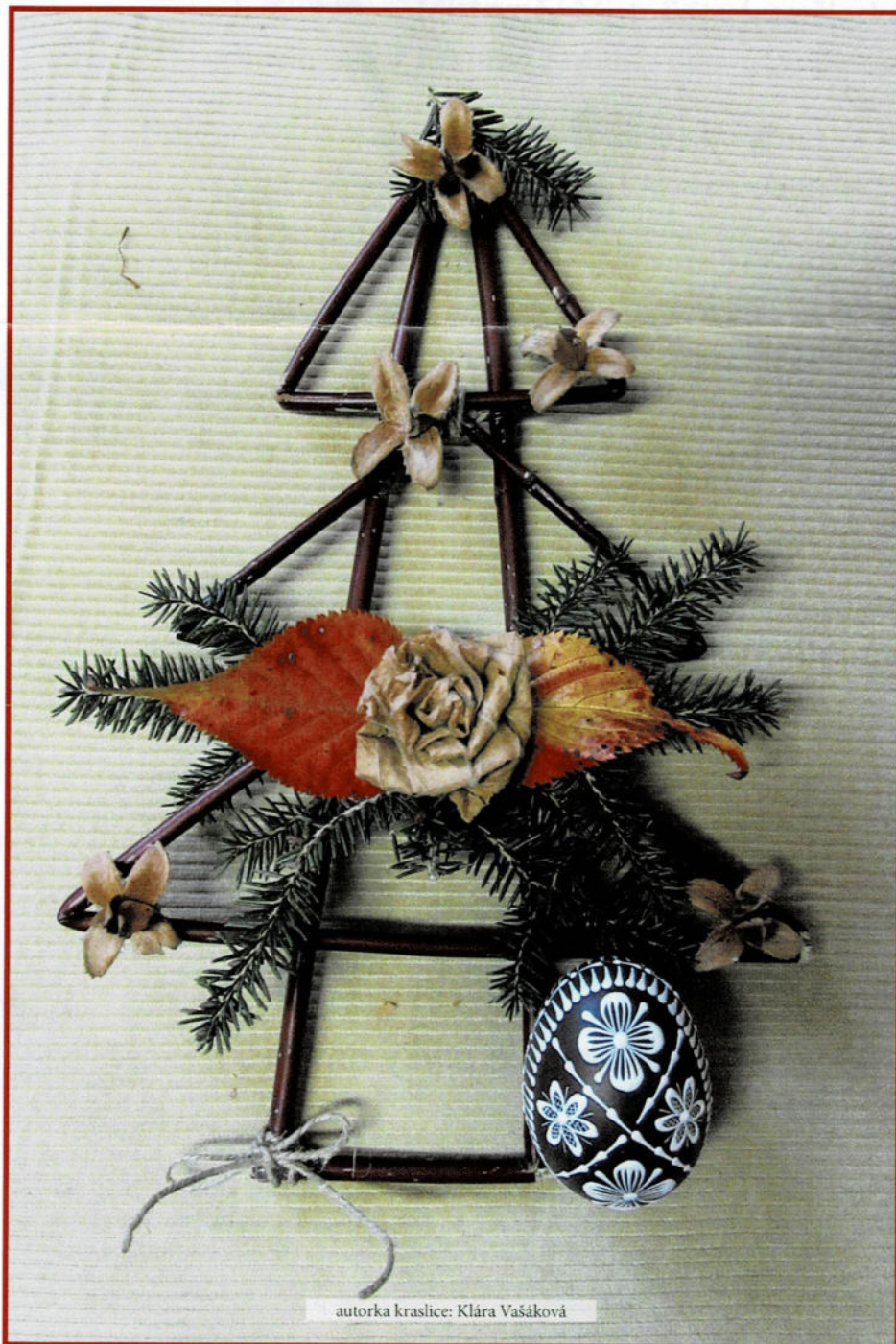
autorka kraslice: Klára Vašáková