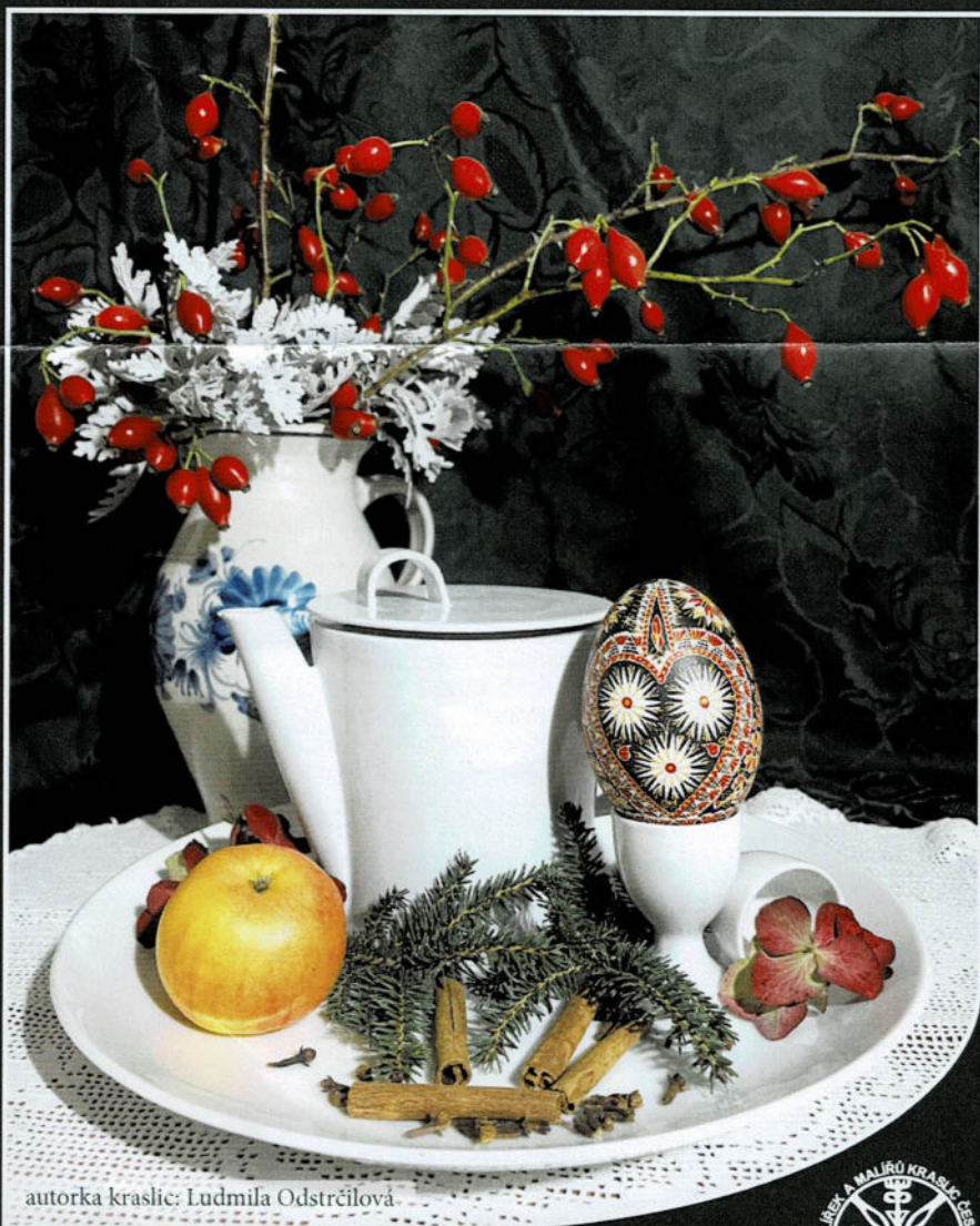
autorka kraslic: Ludmila Odstrčilová